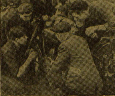
ТБИЛИСИ. На территории придольно-трикотажного комбината создан стрелковый кружок. На снимке слева: группа спортсменов на стрельбище. * КИЕВ. Досармовская мотоциклетная школа при Киевском мотоциклетном заводе недавно выпустила очередную группу. Водительские права получили 25 молодых рабочих и работниц. На снимке справа: группа выпускников у мотоцикла.